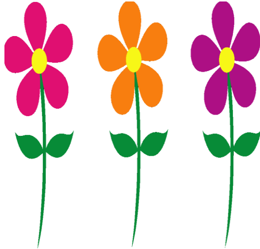
Spring – ربيع (rbye)