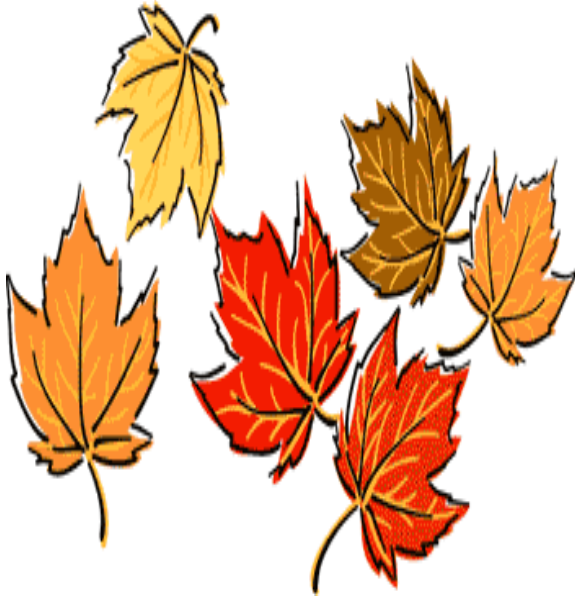
Autumn – الخريف (alkharif)