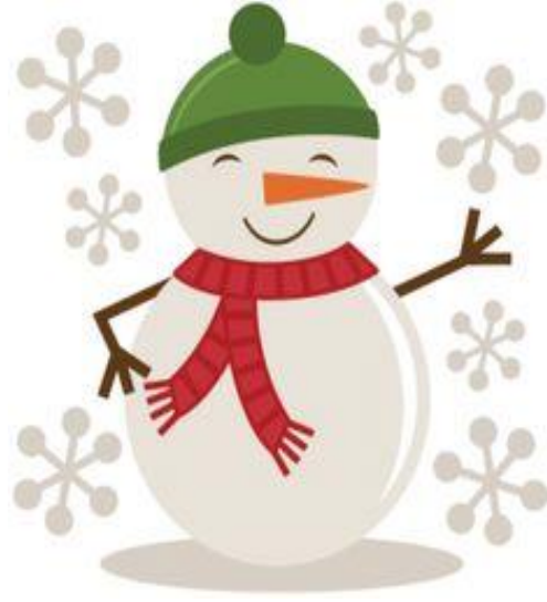
Winter – الشتاء (alshshita')